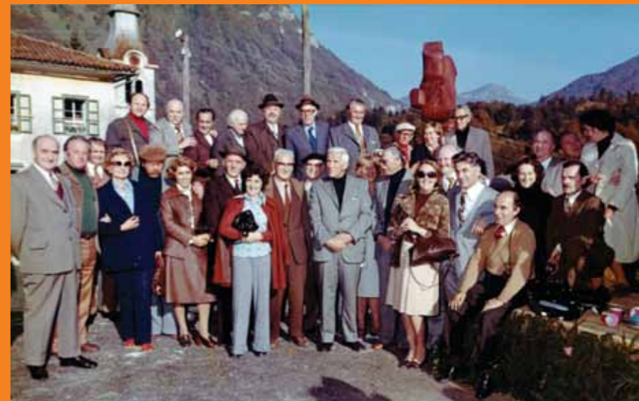
Ekipa filma Na svoji zemlji pred spomenikom oktobra 1975