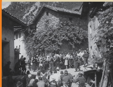
Prizor izbiranja in streljanja talcev v središču Koritnice leta 1947 (del Fabbro)

Tematska pot s Koritnice po desnem bregu Bače zakroži nazaj na Grahovo ob Bači do spomenika snemanju filma, izdelka kiparja Petra Jovanoviča, in zaključne table. Najbližjo medijsko točko najdete v okrepčevalnici Pri Brišarju (05/380 4801, 031/784 581, bojana.brisar@gmail.com). Napovedane skupine lahko začnejo tematski dan z ogledom filma in razstave Tolminskega muzeja Na svoji zemlji – šestdeset let kasneje v prostorih Krajevne skupnosti Grahovo ob Bači, potem pa izberejo krajšo ali daljšo različico Tematske poti .