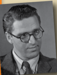
France Štiglic

Filmska ekipa je prvič obiskala Baško grapo pomladi 1947, da bi poiškala snemalne lokacije. »Fantazija je že izbirala iz scenarija najmikavnejše prizore ter jih kombinirala in okvirjala filmske izreze. (...) Pod nami je ležala dolina. Nisi je mogel objeti z očmi naenkrat, marveč si ji moral slediti z zasukom do zadnjih robov, ki so jo zapirali kot filmske makete v prosojni protisončni luči. Po dnu doline se je svetlikala rečica, ob njej sta se križaje zvijali cesta in železnica. Na strmih pobočju so se pod pečinami in strmimi senožetmi bleščale strehe vasi. V tem trenutku je zaživel partizan Sova iz scenarija in kar slišal sem ga, kako pravi z ljubeznijo in ponosom: Stane, glej jo, našo Grapo! ... Da, to je naša Grapa! V njej se odigrava naša filmska zgodba.« (France Štiglic, Stari bomo dvajset let II, Ekran, 1964, str. 1692)